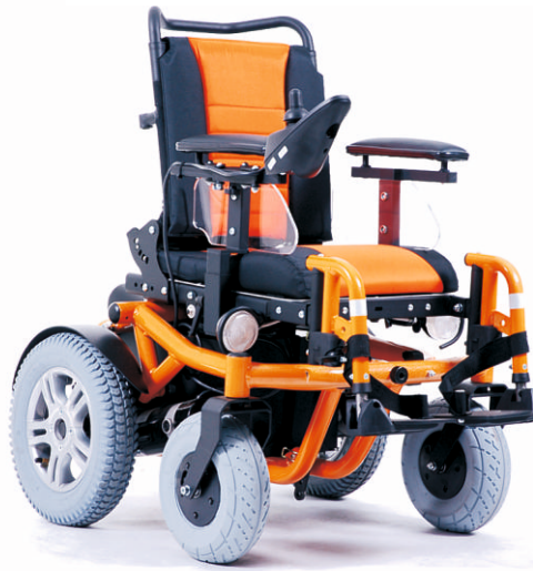
forest kids GT