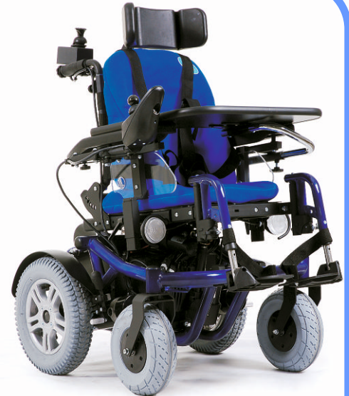
forest kids z wyposażeniem dodatkowym: zagiówek, STABILO, stół, dodatkowy sterownik dla opiekuna