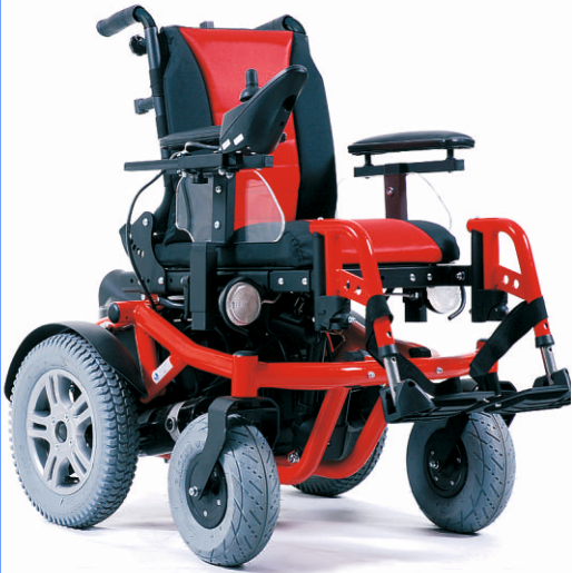
forest kids standard